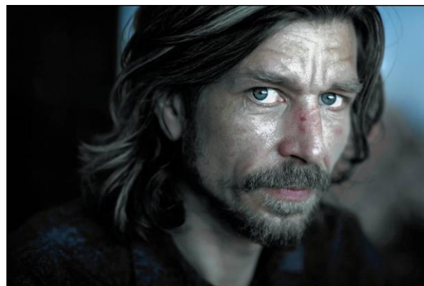
Karl Ove Knausgård