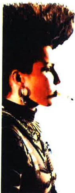
EVIL. Lisbeth Salander gør i Stieg Larssons bøger selv op med ondskaben.

Set i kunsthistoriens store hulspejl er det onde ingen nyhed. Det at nogen gjorde noget ondt ved andre, er blevet skildret utallige gange og temmelig minutiøst, især i fortiden.