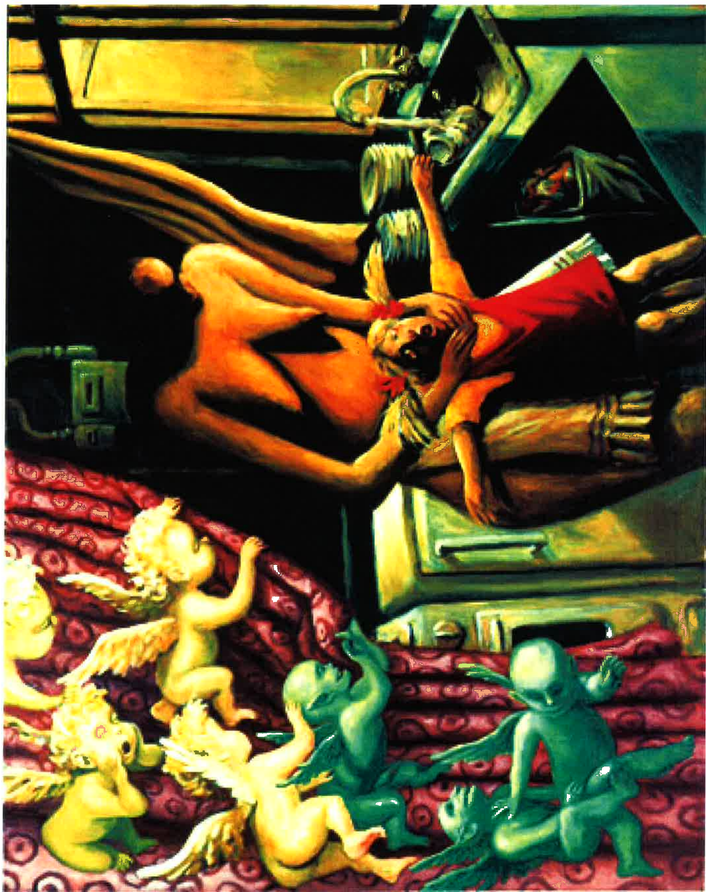
Michael Kvium: En køkkenscene (1986)