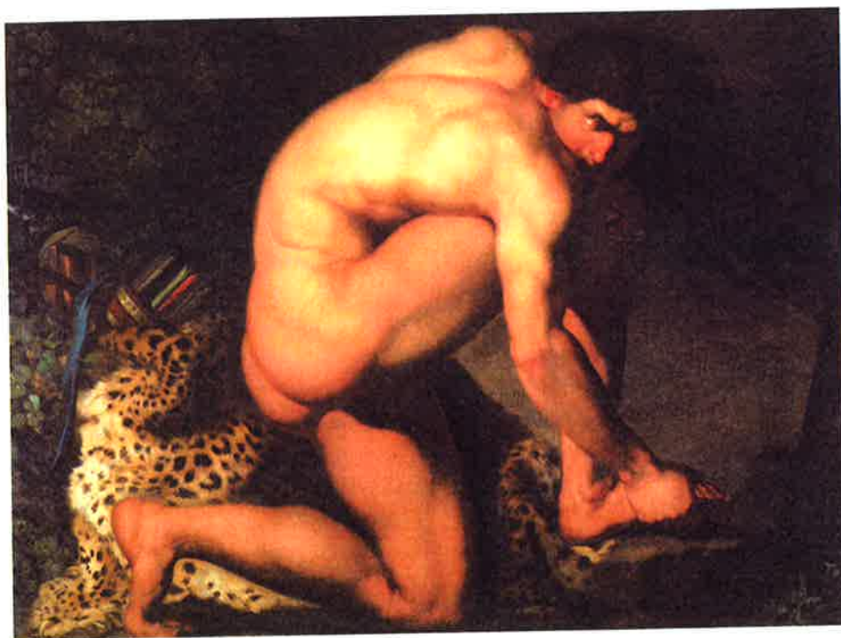
Nikolai Abildgaard: Den sårede Philoktet (1774).

Inden for musikken opstår den såkaldte Wienerklassik med Franz Joseph Haydn (1732-1809), Wolfgang Amadeus Mozart (1756-1791) og Ludwig van Beethoven (1770-1827). I et opgør med barokkens svulmende og mere komplekse stil er Wienerklassikken et mere forfinet musikalsk udtryk af umiddelbare, melodiske og iørefaldende kompositioner.